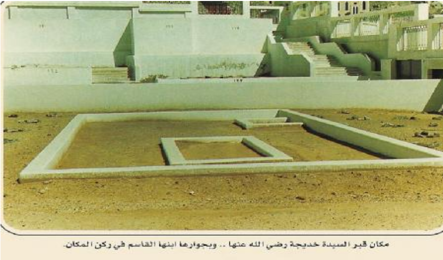
مكان قبر الصبيدة خديجة رضي الله عنها .. ويجوارها ابنها القاسم في ركن المكان.

مَذْكُورَةٌ * تَرْفَعُ بِهَا ذِكْرَهَا فِي مَحَلِّ الْأَبْرَارِ الْأَخْيَارِ * فِي أَشْرَفِ شُرْفِ النَّبِيِّينَ * فِي أَعْلَى عِلِّيِّينَ * فِي الدَّرَجَاتِ الْعُلَى * فِي الرَّفِيعِ الْأَعْلَى * اللَّهُمَّ صَلِّ عَلَى مُحَمَّدٍ وَعَلَى آلِ مُحَمَّدٍ * وَأَعْلِ كَعْبَهَا * وَأَكْرِمِ مآبَهَا * وَأَجْزِلِ ثَوَابَهَا * وَأَذِنِ مِنْكَ مَجْلِسَهَا * وَشَرِّفْ لَدَيْكَ مَكَانَهَا وَمَثْوَاهَا * وَانْتَقِمْ لَهَا مِنْ عَدُوِّهَا * وَضَاعِفِ الْعَذَابِ عَلَى مَنْ ظَلَمَهَا وَالتَّقَمَةَ عَلَى مَنْ غَضَبَهَا * وَخُذْ لَهَا يَا رَبِّ بِحَقِّهَا * إِنَّكَ عَلَى كُلِّ شَيْءٍ قَدِيرٌ * اللَّهُمَّ صَلِّ عَلَى مُحَمَّدٍ وَعَلَى آلِ مُحَمَّدٍ * وَأَبْلِغْهَا مِنَّا التَّحِيَّةَ * وَارْزُدْ عَلَيْنَا مِنْهَا التَّحِيَّةَ * وَالسَّلَامُ عَلَيْهَا وَرَحْمَةُ اللَّهِ وَبَرَكَاتُهُ * ١٤