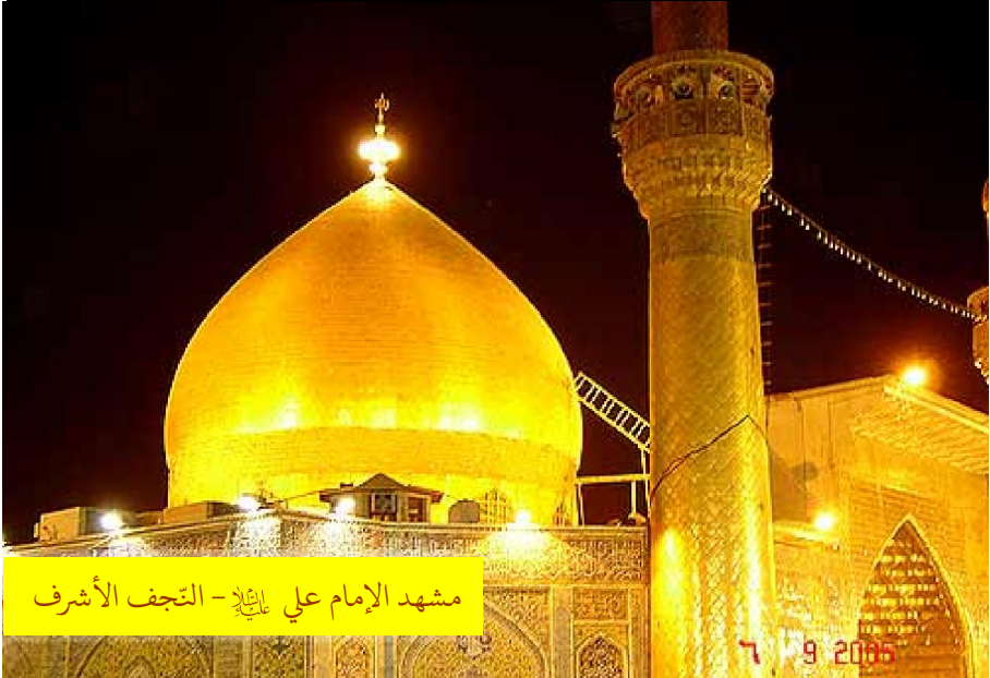
مشهد الإمام علي عليه السلام - النجف الأشرف

أيام تحت الشعاع والمحاق = طلوع ٢٨ إلى غروب ٣٠ ذى القعدة (٣ إلى ٥ أكتوبر)