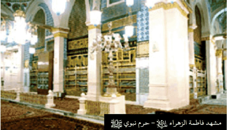
مشهد فاطمة الزهراء ﷺ - حرم نبوي ﷺ

افريقيا، جنوب اوربا، الشرق الأوسط، جزيرة العرب إلى غرب ايران)