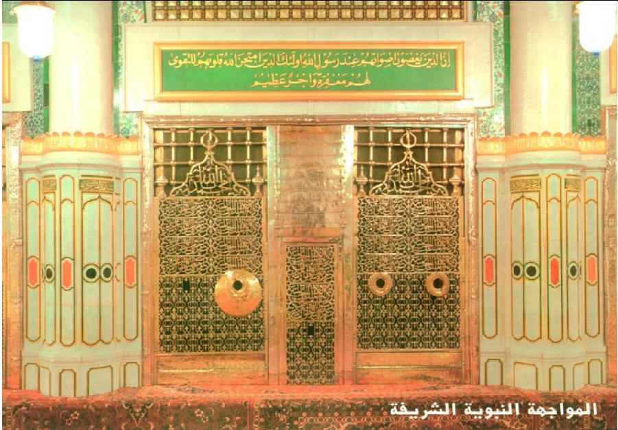
المواجهة النبوية الشريفة

إيام تحت الشّماع والمحاق = ليلة ٢٨ إلى غروب ٢٩ شوال (٤ إلى ٥ سبتمبر)