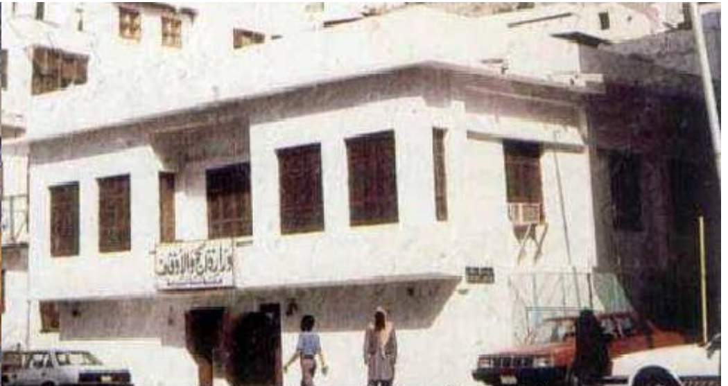
محل ولادت حضرت خاتم الأنبياء (صلى الله عليه وآله) که به نام کتابخانه مکه المكرمة معروف است ناصبیان وهابی از ابتدا حتی به صورت کتابخانه مخروبه نیز تحمل آن را نداشتند، و همواره در صدد مخوکلگی آن بوده اند.

اللَّهُمَّ صَلِّ عَلَى مُحَمَّدٍ رَسُولِ اللَّهِ النَّبِيِّ الْعَرَبِيِّ الْهَاشِمِيِّ الْأُمِّيِّ الْأَبْطَحِيِّ الْمَكِّيِّ الْمَدَنِيِّ